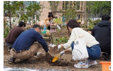
2023年10月22日実施 植樹祭の様子

公園内には、国立競技場を臨むシンボリックな位置づけの「希望の広場」、円形デザインが特長の「インクルーシブ広場」、渋谷川の水景を現代風にアレンジし再現した「みち広場」の3つの広場と、約7,500㎡を有す樹林地「誇りの杜」を整備。あらゆる世代の方々に向け、「憩い」「交流」「遊び」「学び」「自然との共生」など多彩な“体験の場”を提供します。2023年10月22日には、一般の方々と植樹祭を実施、ハーフレイドの杜づくりの第一歩を踏み出しました。